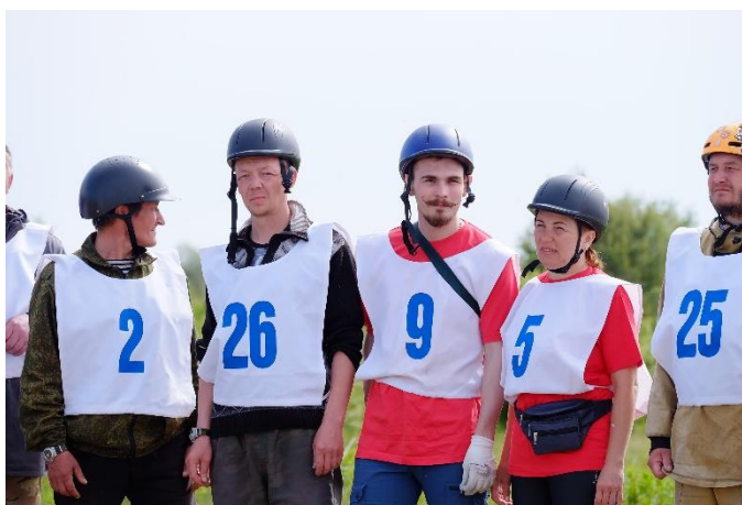
Рисунок 1 – Участники соревнований по спортивному туризму на конных дистанциях «Мезенка Т.Р.Е.С»

Текст текст текст текст текст текст текст текст текст текст текст текст текст текст текст текст текст текст текст текст текст текст текст (рис.1). Текст текст текст текст текст текст.